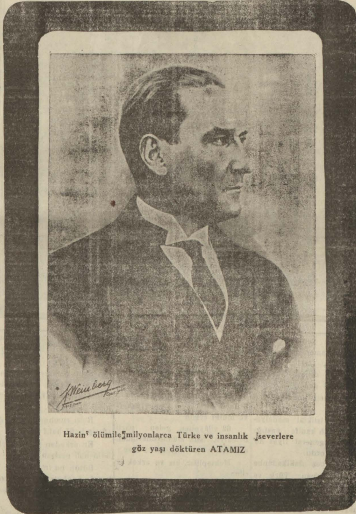
Hazin ölümüyle milyonlarca Türke ve insanlık severlere göz yaş döküren ATAMIZ

Aziz Türk milleti, sen sağ ol. ATAM!.. dünya durdukça senin eserlerin baki kalacak. Sen ebedî olan Türk milletinin kalbinde yaşıyacaksın.